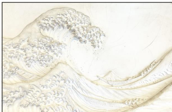
富嶽三十六景 神奈川沖浪裏（レリーフ） 葛飾北斎/画 手と目でみる教材ライブラリー所蔵