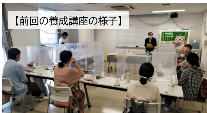
【前回の養成講座の様子】